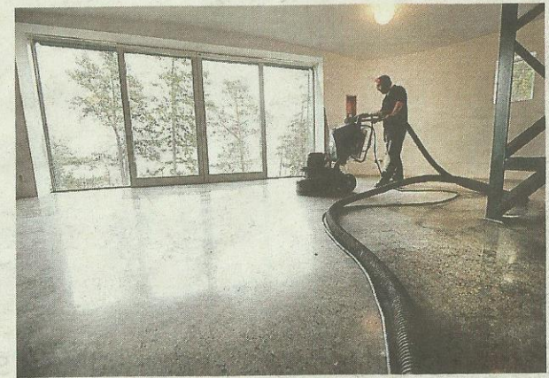
PUTS. Otto Segerros gör sista poleringen av betonggolvet.