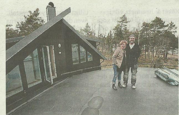
TAKTERRASS. Strålande utsikt från radartaket.