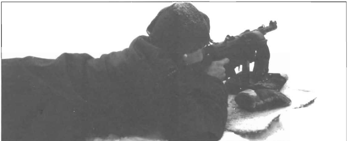
Vad händer om jag trycker här?