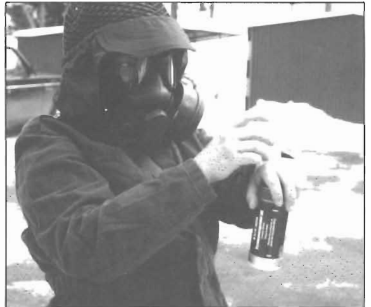
Det perfekta skyddet mot grannens surströmmingsskiva.