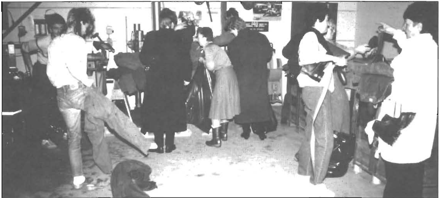
Stormarknad à la second hand.