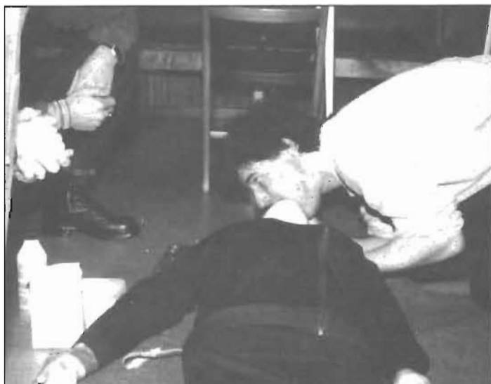
"Aj, släpp min tunga!"