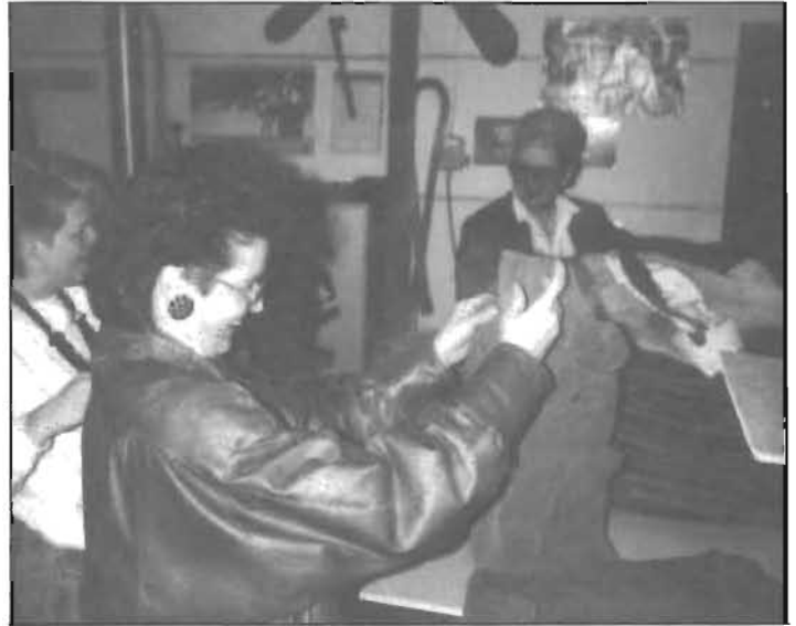
- Det är tur att min man inte ser mig i dom här byxorna!