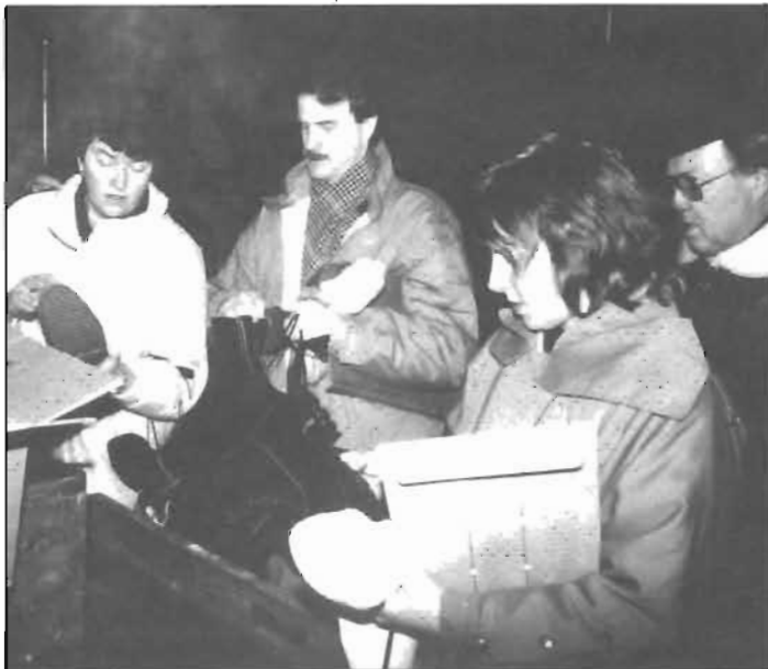
Familjerabatt – köp sex, betala för fyra!