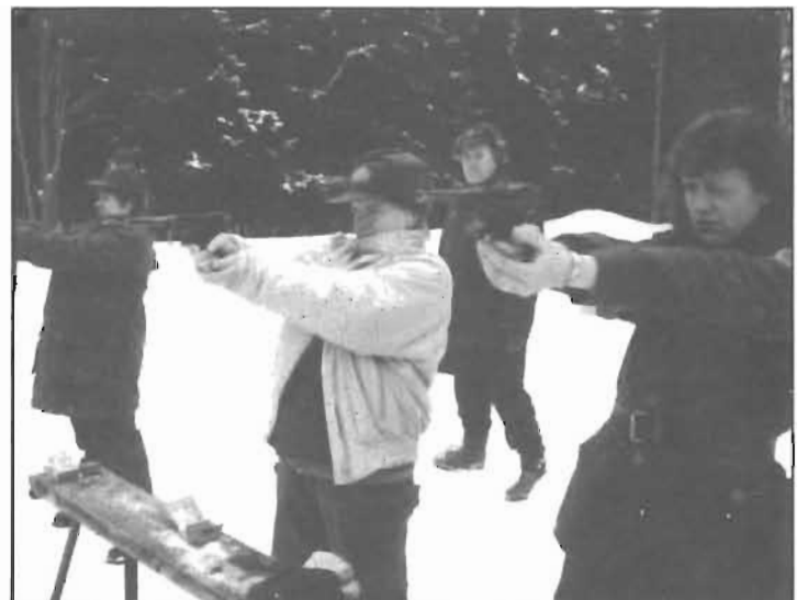
"Släng dig i väggen Rambo" – oss tar du aldrig!