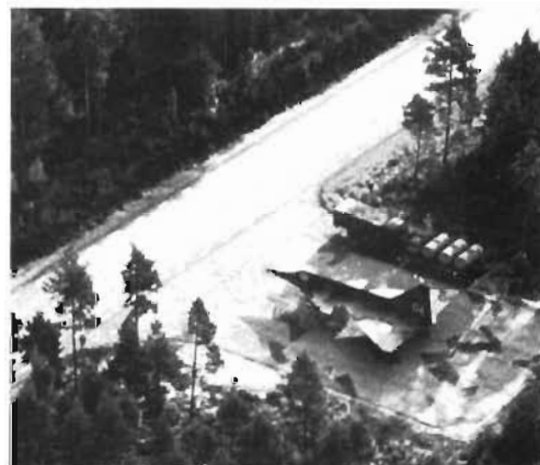
Skenmål/fpl-atrappor vilseleder en an-gripares spaning och försvårar hans bekämpning av våra krigsbaser.