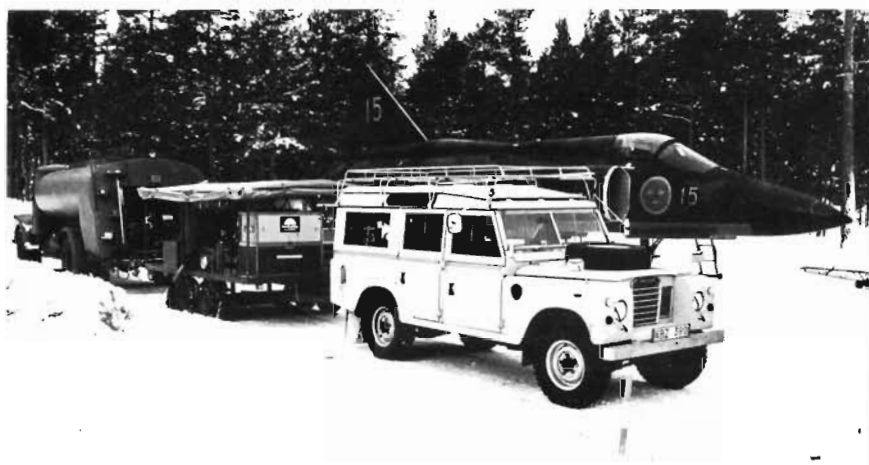
◀ Tankbil, klargöringsvagn med dragfordon på klargöringsplats. — T h: Fpl 37 'Viggen' startar från vägbas.