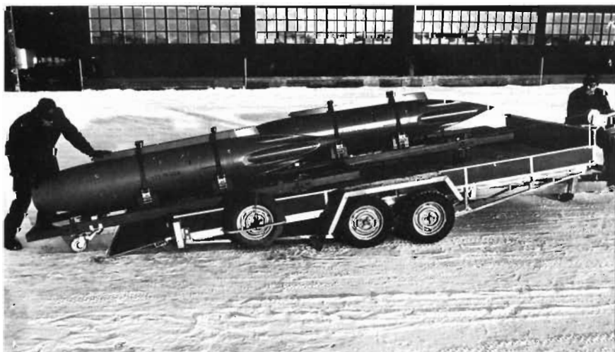
◀ Ny transportvagn för hantering av fpl-vapen. — T h: Fpl 35 'Draken' taxar upp från bergshangar.