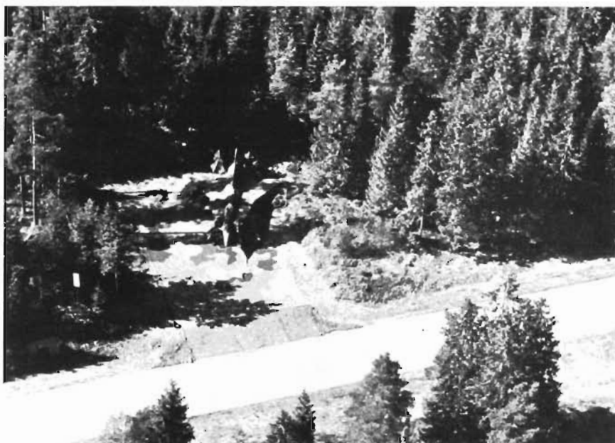
● Enbart färgkamouflage på fpl och platta ger ett första skyl.

Inom bassystemet betyder varje arbetsinsats väldigt mycket för vår