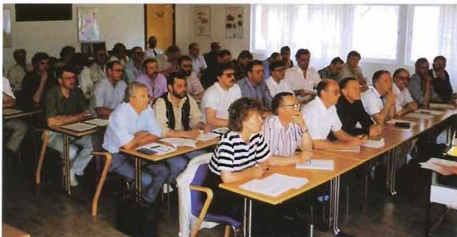
En bild från kundmötet med Armén.

Gruppdiskussionerna resulterade i ett antal punkter, vilkas lösning är av stor betydelse för FMV:RESMAT som leverantör. En överenskommelse träffades om att dessa punkter skall prioriteras, åtgärder presenteras löpande och bekräftelse lämnas under nästa