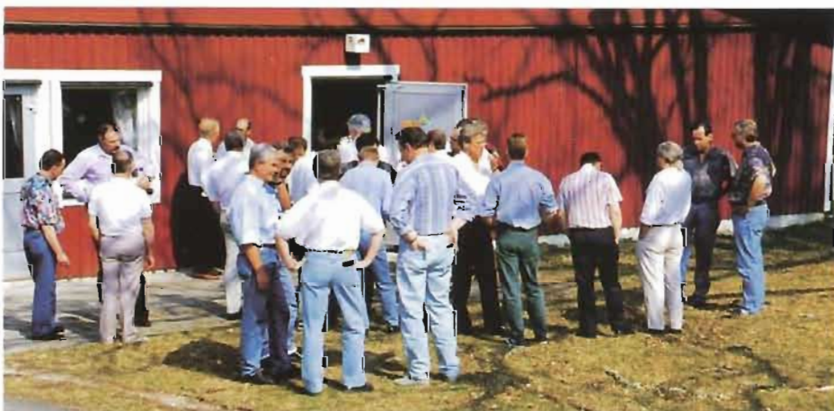
Kort paus utanför utbildningslokalen vid Ekvägen i Arboga.

kundmöte. Följande punkter kom mötet fram till: