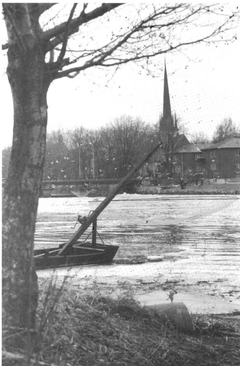
Våren leker med aprilvädret och norsen leker i Arbogaån. I det forsande vattnet samlas fiskstimmen. På Herrgårdsbron samlas åskådarna. Sänkhåvarna fångar de små laxfiskarna i sina nät till mäsarnas skrånande ackompanjemang.