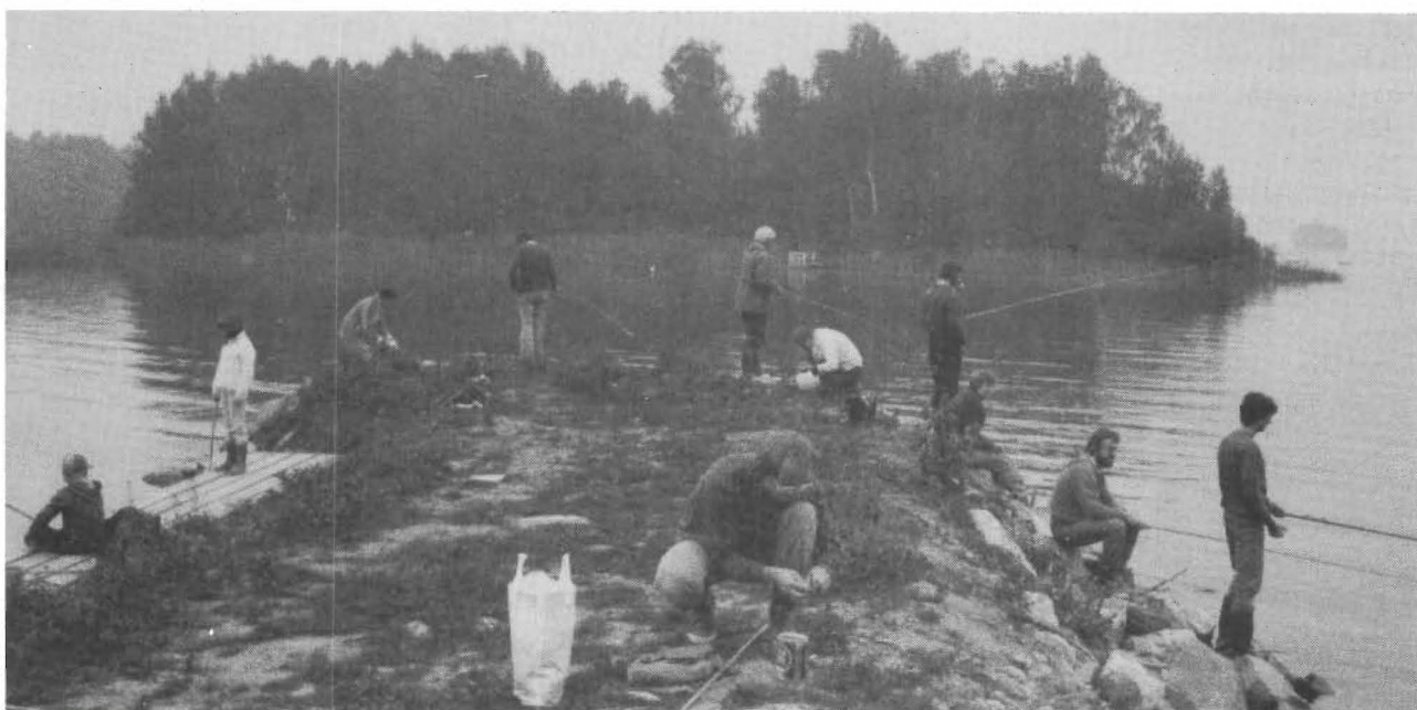
Hela sektionen klämde in sig på samma udde när Microfish tävlade i sommarmete. Tala om sammanhållning! Chefen med sitt vita hår ställde sig på spetsen och hamnade alltså i täten också geografiskt sett.