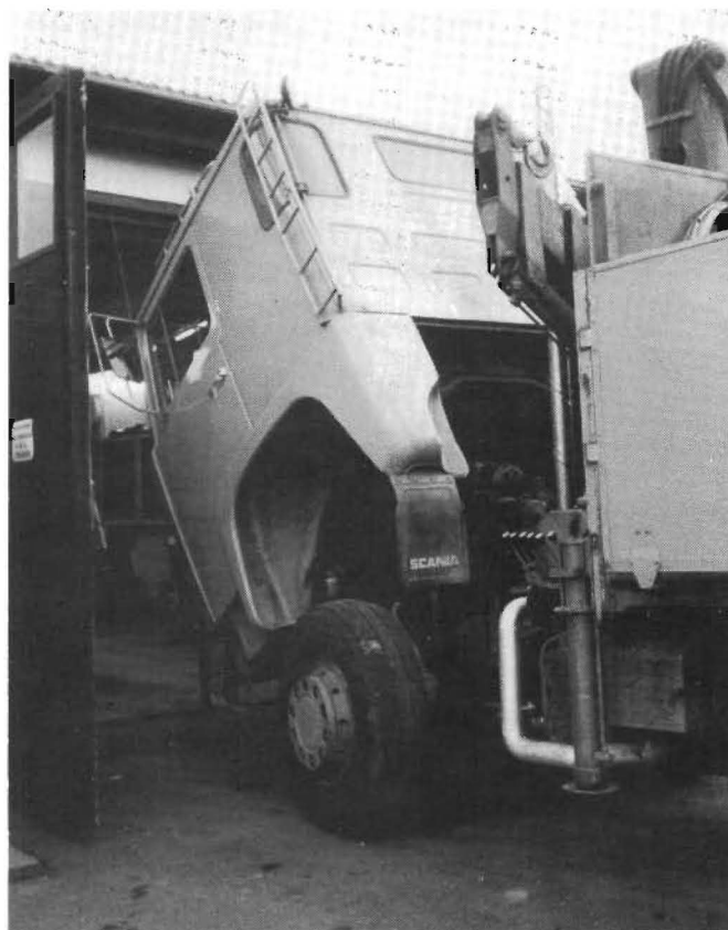
Lastbilarna går inte in genom verkstadsporten. Inte ens om de bockar sig fint.

Den här gången har Erik och jag pratat om vilken olycka det är att portarna till verkstan är för låga.