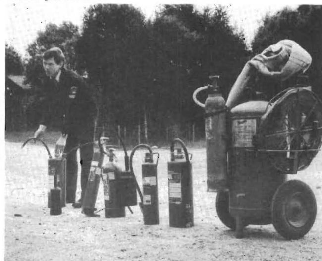
heter med kameran. Men snart återgick allt till det normala. Roland fortsatte att instruera övnings- gruppen om olika typer av brandsläckare och Hans skötte kameran.