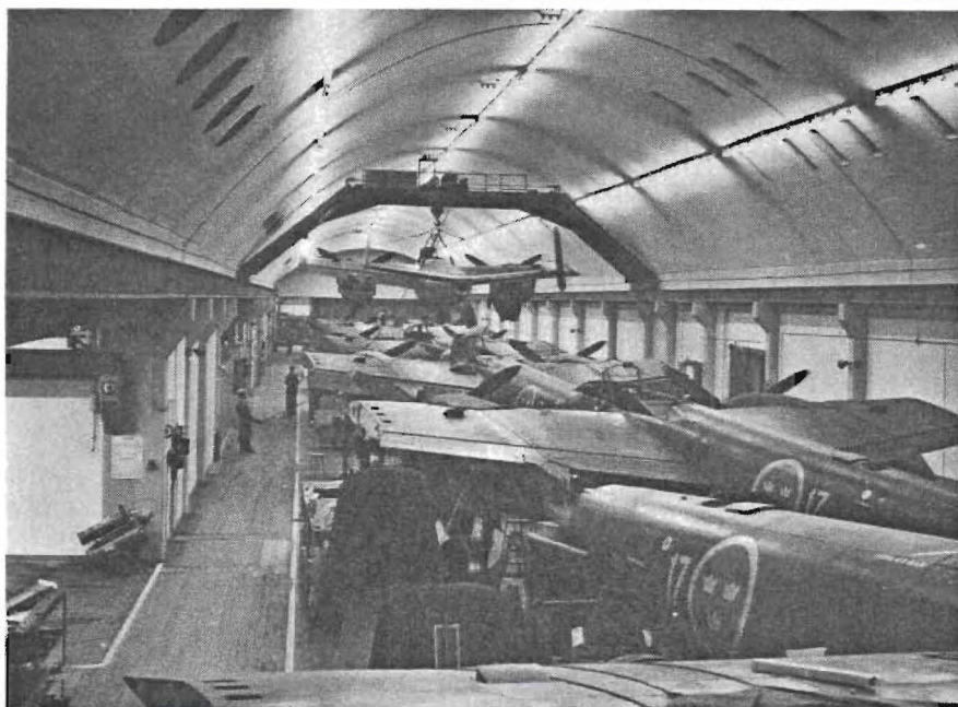
Känner ni igen P-tunneln? Bilden är en av många som finns i CVAs digra bildarkiv. Den är tagen i november 1949 och visar B18-plan i bergverkstan.