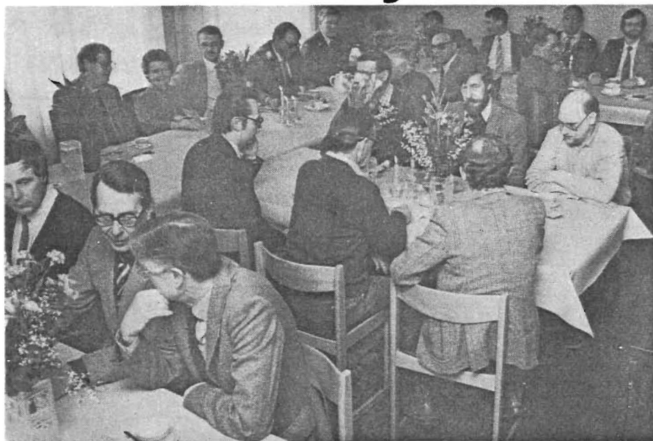
Det var stor tack och avskedslunch på Gyllene Balken senaste månadsskiftet. Förutom tre ålderspensionärer lämnade samtidigt 14 medarbetare företaget med årlig ersättning. Alltså blev det en ovanligt välbesökt pensionärlunch i gästmatsalen denna gång. De avgående uppvaktades vid lunchen av sina chefer och av representanter för facken.