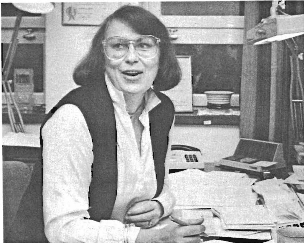
Pensionärskurserna ingår i Gurlis ordinarie arbete. Utbildning för pensionärer är ett krav från både företagsledning och fack.

– Det är jätteroligt att hålla de här kurserna, säger hon.