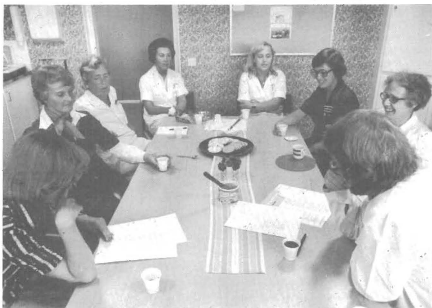
Har pågår gemensamt arbete! Hälsocentralens personal har samlats till internt möte.

Fria läkarvård var förmodligen inte känt bland de gamla grekerna, men redan de första CVA-arna som påbörjade sin verksamhet i Arboga 1945 kände till begreppet. Även om det - sett med 70-talets ögon - finns skäl att anmärka på 40-talets "företagshälsovård" så bör ingen skugga falla över dåtidens intensiva satsning på närbkontakt. Som exempel kan nämnas, att sjuksköterskans rum användes såväl för expeditionsgöröml som för av- och påklädning (bak döljande skärmar) och behandling. På den punkten, liksom i övrigt, har den fria läkarvården genomgått påfallande förändringar under de senaste 30 åren.