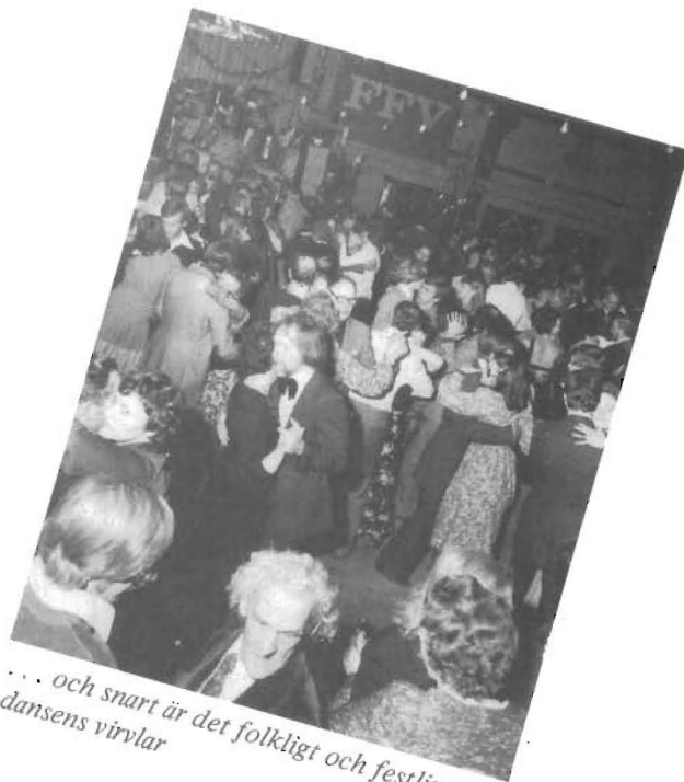
... och snart är det folkligt och festligt i dansens virvlar