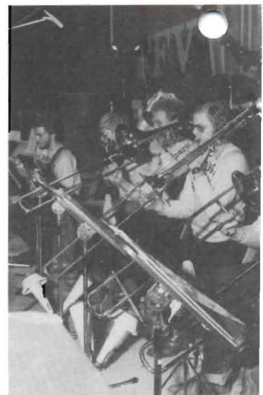
Trycket från brasset satt skönt! A sam uppgift: det var ständigt fullt

Till festkommittén, anläggningssekt medverkat vid ordnandet och nom alltigenom lyckad, vill jag framföra