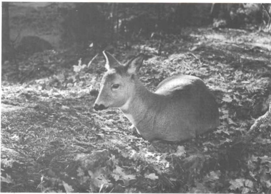
Lisa ligger här en solig morgon och poserar gärna för fotografen.