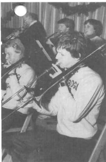
hoga Junior Big Band hade en tack- ä dansgolvet