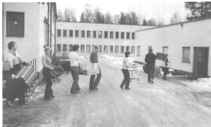
Springa hit, bära dit, flytta allting bit för bit . . . . .

-Uppriktigt sagt är det härligt att slippa tillbaka mellan Ekbacken och CVA. Och dessutom skönt att ha folk i Boda. Det blev litet en