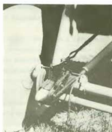
Så här klena är Tummelisans ar-mortisörer - men de duger ännu.