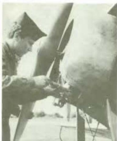
En mekaniker snapsar motorn med injektionspruta m/jättelik.

Tummelisan skall flygas ner till ungefär 30 meters höjd innan gasen dras av och föraren trepunktslandar. Att komma ner på sporre och ställ samtidigt är svårt eftersom flygplanet är kort och nosläget högt.