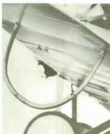
Under vardera vingspetsen sitter en skyddande båge av bambu.