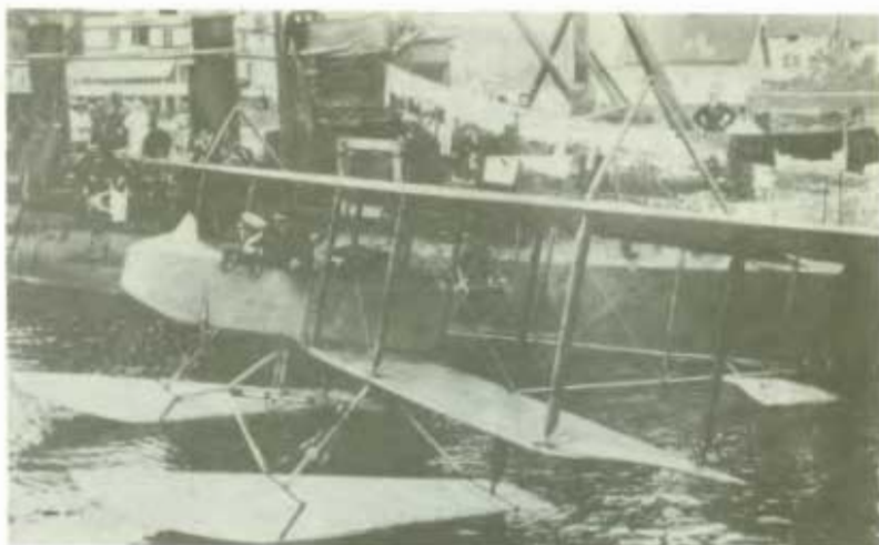
"Toffelutrustad Farmankärra" under neutralitetsvaktens dagar.

Med augusti månad 1914 kom världskriget och skapade oro även hos oss. Den mobilisering som genomfördes samlade inget stridsdugligt flygvapen i vanlig ordning. Det viktigaste var att fortfarande ägna sig åt utbildning av flygare och flygepanare på det fåtal maskiner som fanns till förfogande. Inom marinens flygväsen fick däremot flygarna även uppdraget att ingå i neutralitetsvakten vid våra kuster. Man hade maskiner som var utrustade och byggda för start och landning på vatten - men de var bräckliga och tålde givetvis ingen grov sjö.