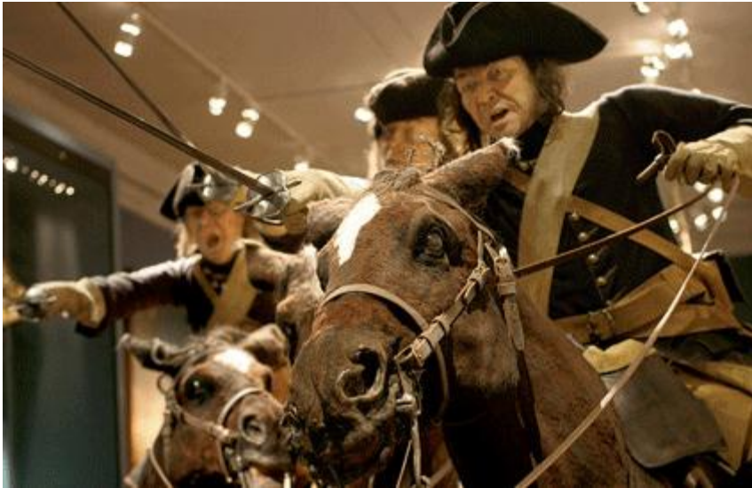
Bilder från Armémuseum. Foto Martin Naulé.

Militärhistoria kan låta lite mossigt. Varför ska man läsa om gamla slag och kungar? Konjunkturerna för ämnet har växlat. I tider av stora förändringar som till exempel efter stora nederlag har det blivit ett uppsving. Så var det när den svenska stormaktstiden var över 1721 och när Finland förlorades 1809. I USA medförde Vietnamkriget ett nyväckt intresse för 1800-talstänkaren Carl von Clausewitz.