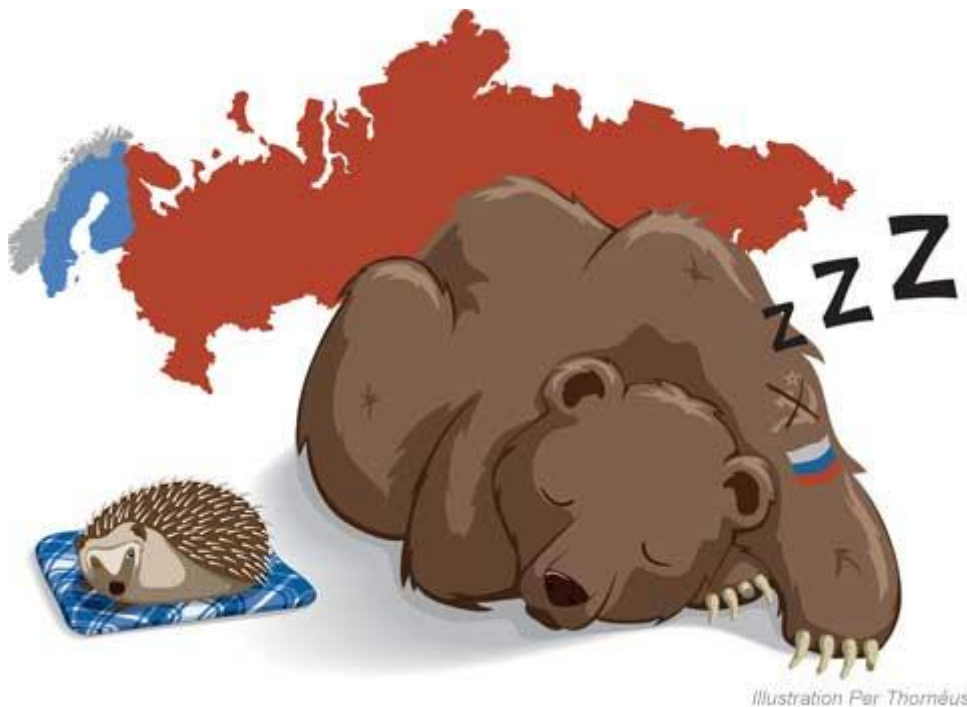
Illustration Per Thoméus

En liten granne måste alltid vara vaksam på den stora grannen. Därför måste Sverige alltid ha en stark Rysslandsforskning oavsett vem som styr i Kreml. Demokrati, auktoritär stat eller stagnation. Vilket framtid som än väntar Ryssland får det inte komma som en överraskning för dess små grannar.