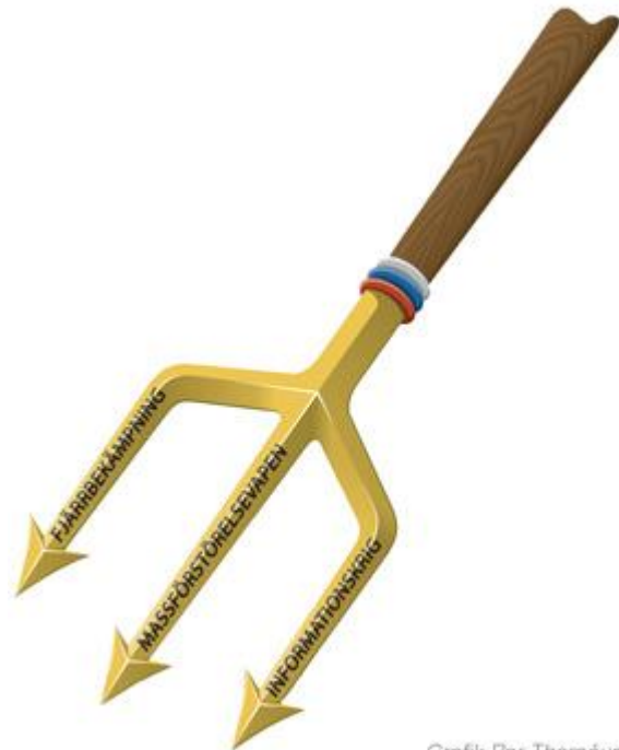
Grafik Per Thornéus