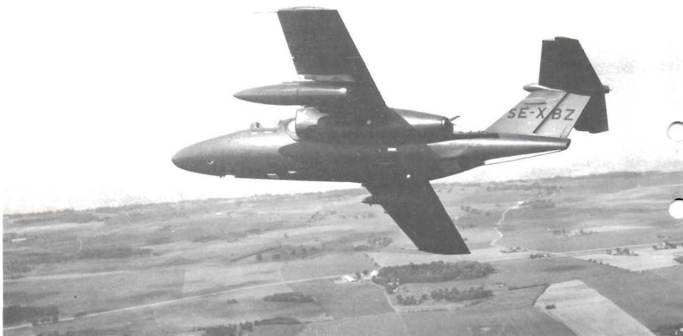
Red Baron Pod installed on SAAB-105