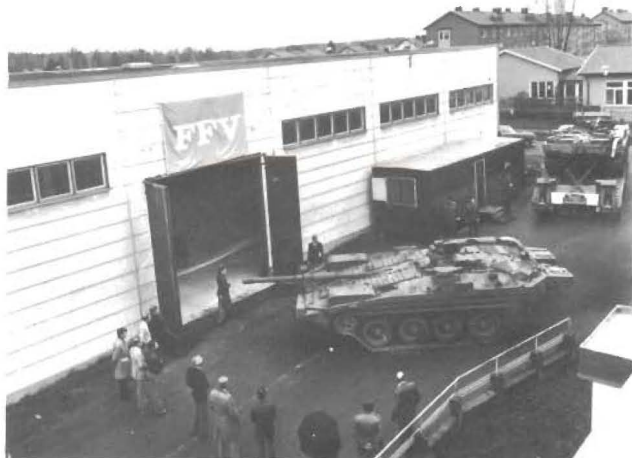
I den f.d mattfabriken har mattorna rullat färdigt. In rullar strv 103.

— Hur kan det vara fel att tre träta, när det inte är ens fel att två gör det? (Blandaren)