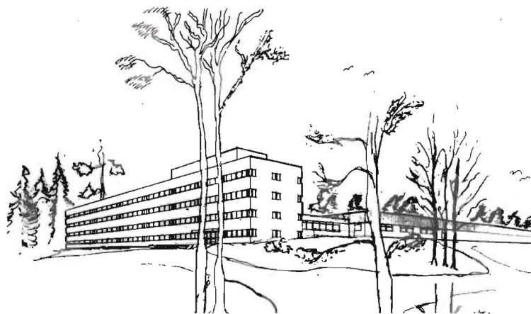
Kontoret för sektion Telemätinstrument och vapen beräknas bli färdigt till jul. Men det blir inte riktigt så dominerande som teckningen visar.