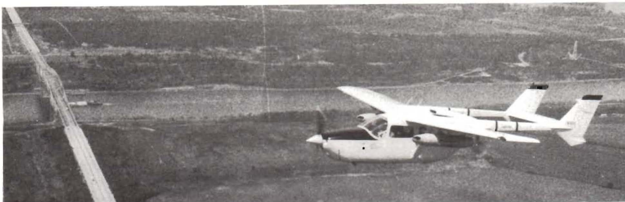
Två FFV UNI-GUN POD har provflugits i USA på en Cessna O-2 Skymaster av ett företag som vi diskuterar samarbete med. Här flyger Skymastern med kapslarna över Chesapeake-kanalen i Delaware.

om försäljning av våra produkter, därtill fordras mångåriga ansträngningar. Men så mycket kan vi i alla fall avslöja, tidigare flygmässor har gett lovande resultat: kontraktförhandlingar pågår!