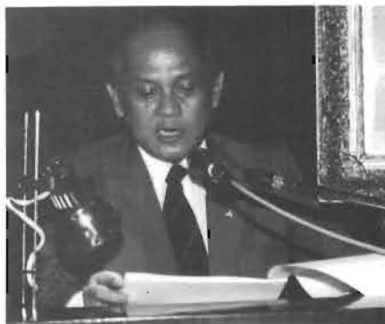
Dr Habibie, minister för forskning och utveckling i Indonesien och förespråkare för en inhemsk flygindustri.