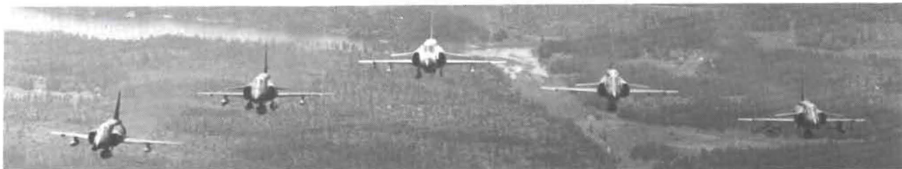
De fem Viggen-versionerna. Fr v SH 37, SF 37, JA 37, SK 37 och AJ 37.