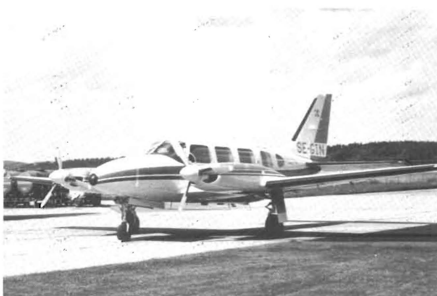
PIPER PA 31 "Navajo" får representera det civilflyg som diskuterades i IKU.