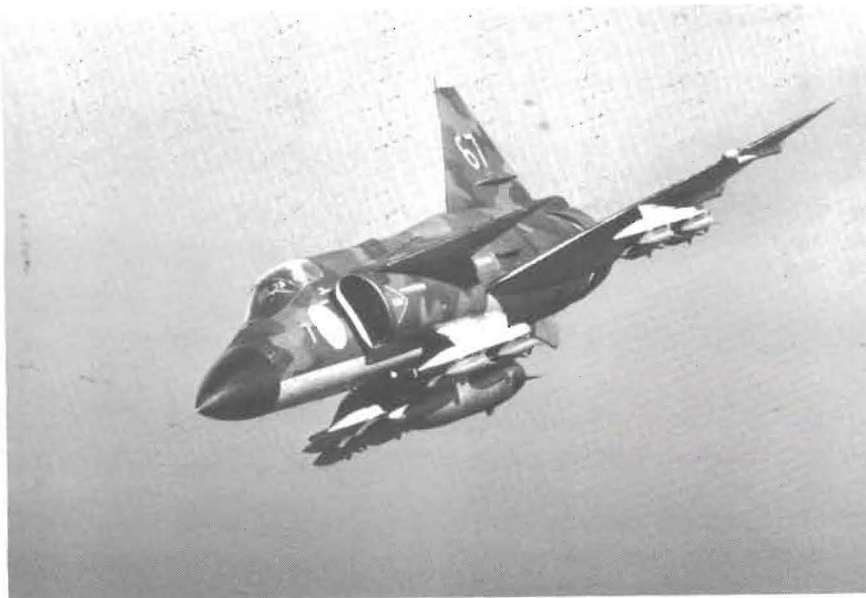
AJ 37 Viggen.

Inget är emellertid så bra att det inte kan bli bättre. QU/CVM har därför uppmanat företaget att snarast samla berörda förband för att närmare höra deras erfarenhet av modpaket 3. Här