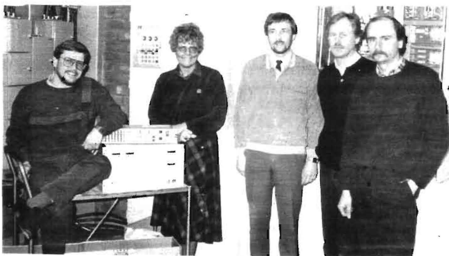
"BE:are är vi allihopa."

– Trygghet genom att vi kan se fram emot ett år med god beläggning. Oro på grund av att vi kan få svårigheter med leveranstiderna. Än så länge ser jag beläggningsläget bara positivt, ty med gemensamma ansträngningar kan vi kla- ▶