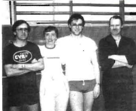
Segrarna i CVA IFs bordtennismästerskap 1985: