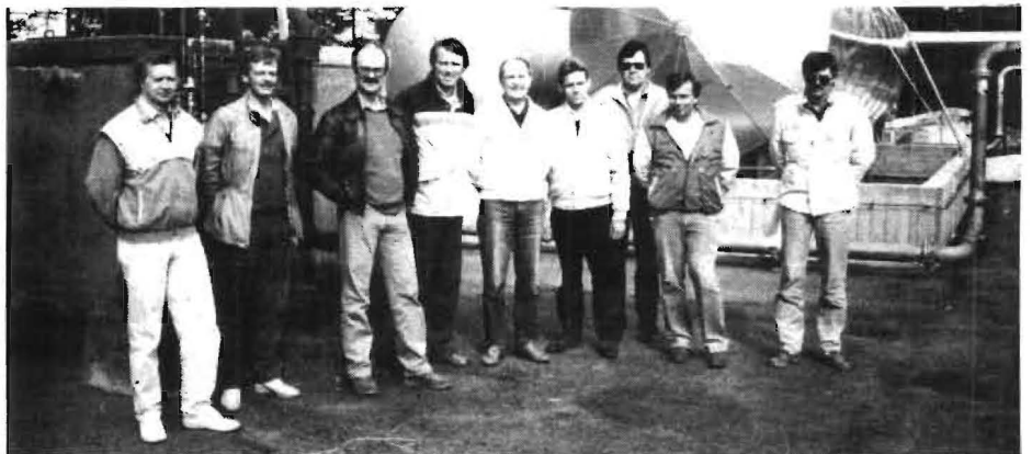
Sex elever och tre lärare poserar framför kameran:

Det var sex tekniker från F16 och F21 som "slitit sig" från skolan och besökte division Basmateriel för ett utbildningsmöte. I dagarna två guggades de i hur man handhar stationsmateriel till flygplan 37. Samtidigt fick dom ingående information om FFV Underhåll i allmänhet och dess division Basmateriel i synnerhet.