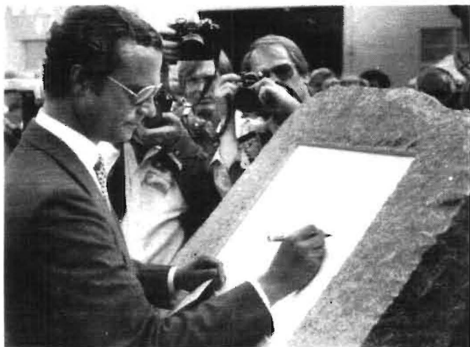
Den som trott att vi skulle få se Hans Majestät Konungen "hugga i sten" misstog sig grundligt. Istället skrev han sin namnteckning på ett vitt papper, som placerats på minnesstenen. Denna namnteckning kommer nu att etsas in i stenen, innan den sätts upp på lämpligt ställe inom FFV-området.