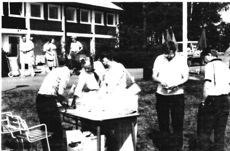
Lotterna hade en strykande åtgång under SAF-dagen.