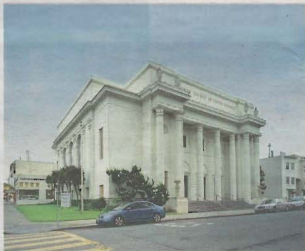
Internet Archives huvudkontor ligger en neoklassicistiskt byggnad i San Francisco som tidigare används som kyrka.