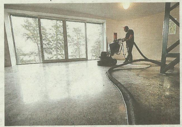
PUTS. Otto Segerros gör sista poleringen av betonggolvet.