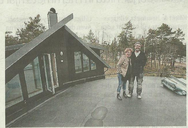
TAKTERRASS. Strålande utsikt från radartaket.